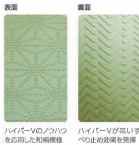
ハイパーVのノコハウを応用した柄模様