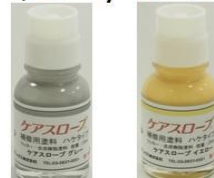
⑩補修塗料ハケタイプ グレー / イエロー